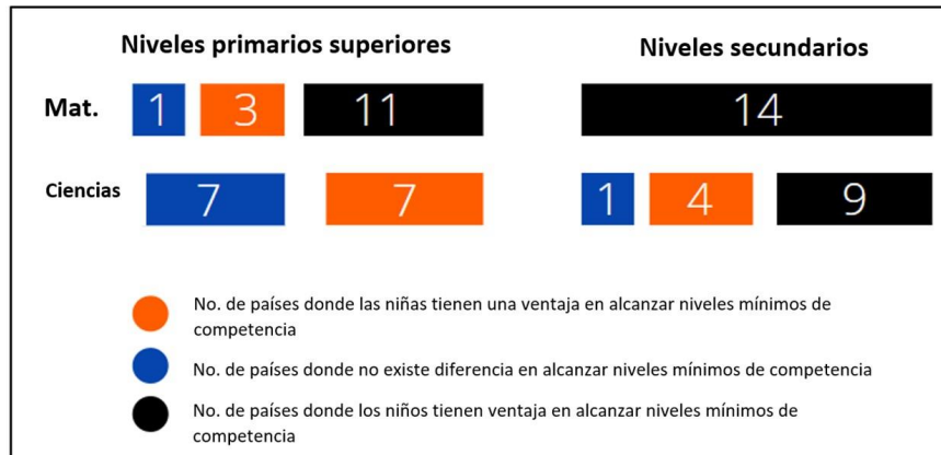
Figura 2. Número de países de LAC que informan disparidades de género en los niveles mínimos de competencia (NMC) en matemáticas y otros temas relacionados con las ciencias.

Es importante destacar que este estudio evidenció además que el nivel socioeconómico es un componente clave en la exploración, medición y tratamiento de las disparidades en CTIM. El estudio sugirió que los niños y niñas de nivel socioeconómico más bajo en la región de LAC tienen una mayor probabilidad de obtener peores resultados en cuanto al rendimiento/calificaciones en CTIM que los niños y niñas de nivel socioeconómico más alto, cuando asisten a las mismas escuelas y utilizan el mismo plan de estudios (↑UNICEF, 2020). Este hallazgo señala la importancia de adoptar una perspectiva de igualdad de género amplia, sistémica e inclusiva, en la que se consideren los diferentes factores que influyen en la equidad para medir y mejorar las brechas en los campos relacionados con CTIM. Un aspecto clave para implementar esto en la práctica es reconocer y abordar la interseccionalidad en las brechas de género, considerando otras desigualdades interseccionales, históricas y estructurales que pueden influir en el acceso a oportunidades equitativas e impactantes.